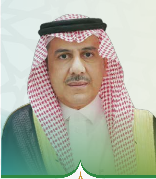
❖ سعادة الأستاذ ❖